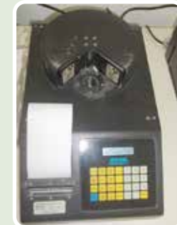
Analizador de Rayos X ASOMA 100