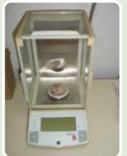
Balanza Electrónica OKAUS